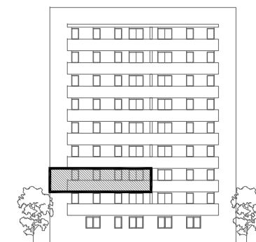
VANJSKO PARKIRALIŠNO MJESTO B66